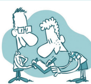
Регистрация на пункте допинг-контроля