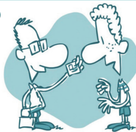
Уведомление спортсмена о необходимости сдать пробу