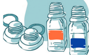
Разделение пробы по флаконам «А» и «В»