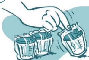
Выбор мочеприемника (емкости для сдачи пробы)