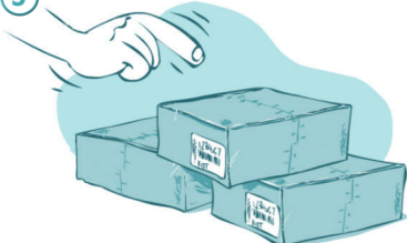
Выбор комплекта для хранения пробы